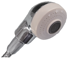
A. 兩段式洗頭蓮蓬頭